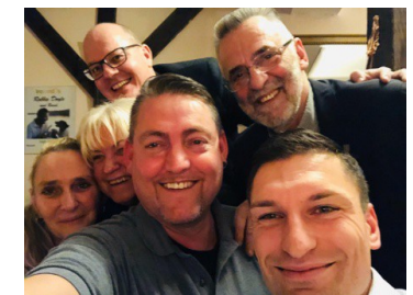
Freunde helfen sich