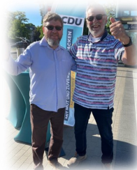
Jürgen und Jürgen