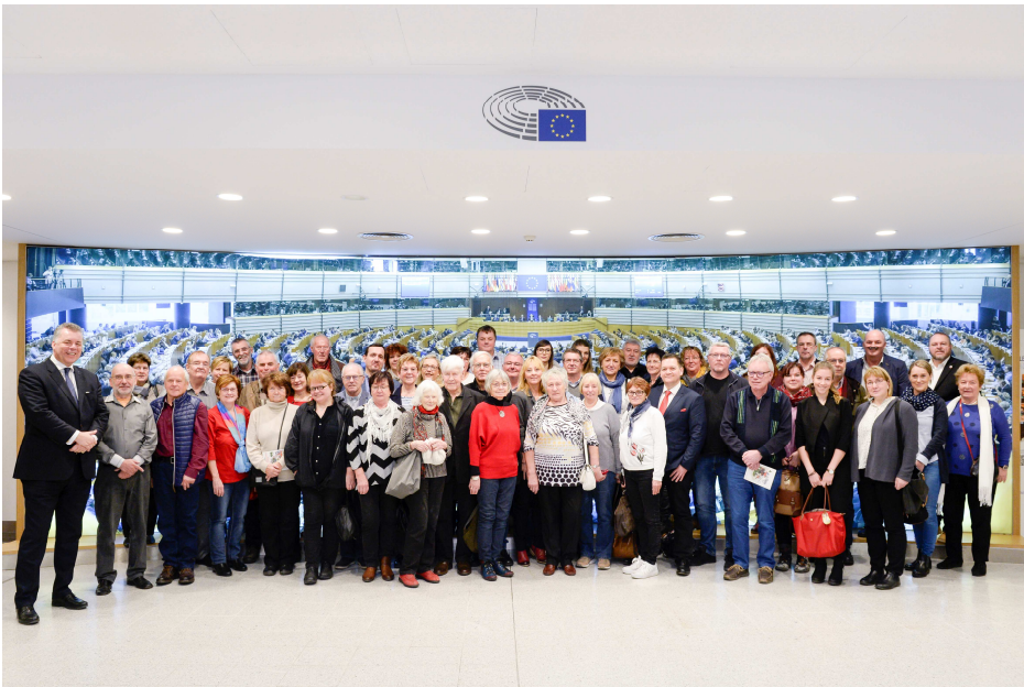
Die „wilden“ Rangsdorfer unterwegs in Brüssel...